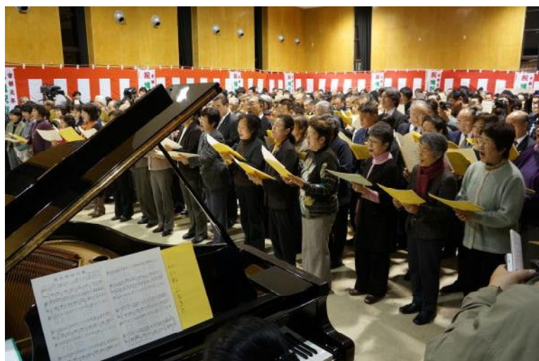
10年前、当時の市制移行イベント、参加者で「いいねふるさと」を歌う