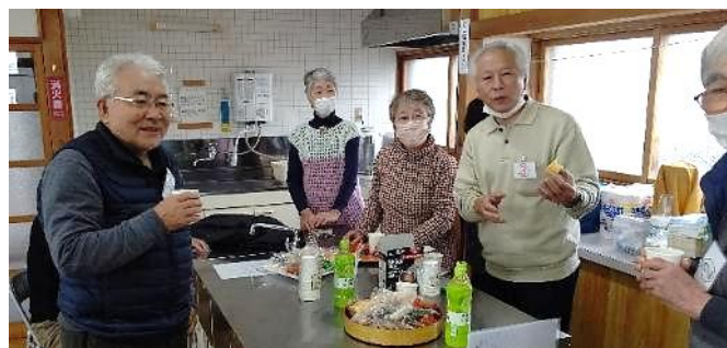
モグモグタイム これも楽しみのひとつ

大会終わりには皆さんが賞品・景品をいただき、勝ち負けに関わらず笑顔で大会を終了しました。皆さんお疲れさまでした。