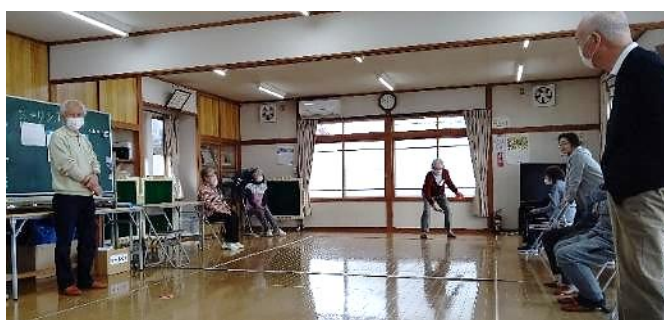
投盤と盤（ディスク）の行方を見つめるメンバーの方々