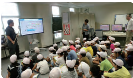
小学校社会科見学(滝沢浄水場) 水道のしくみや水資源の大切さを学習