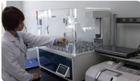
年間を通じて水道水質は良好でした