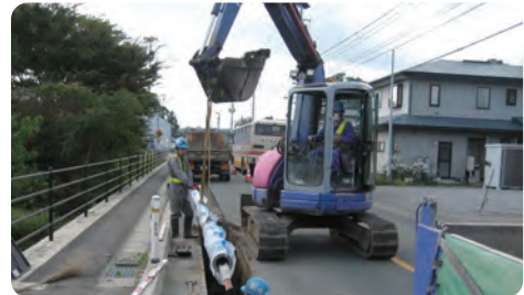
地震等に強い水道管を整備しました