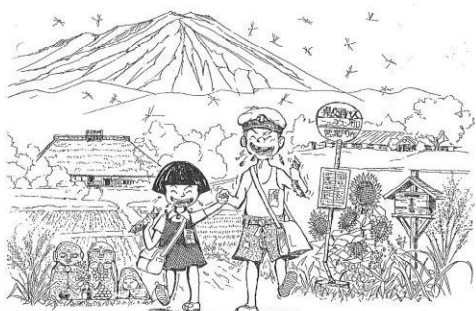
カットも立派な作品