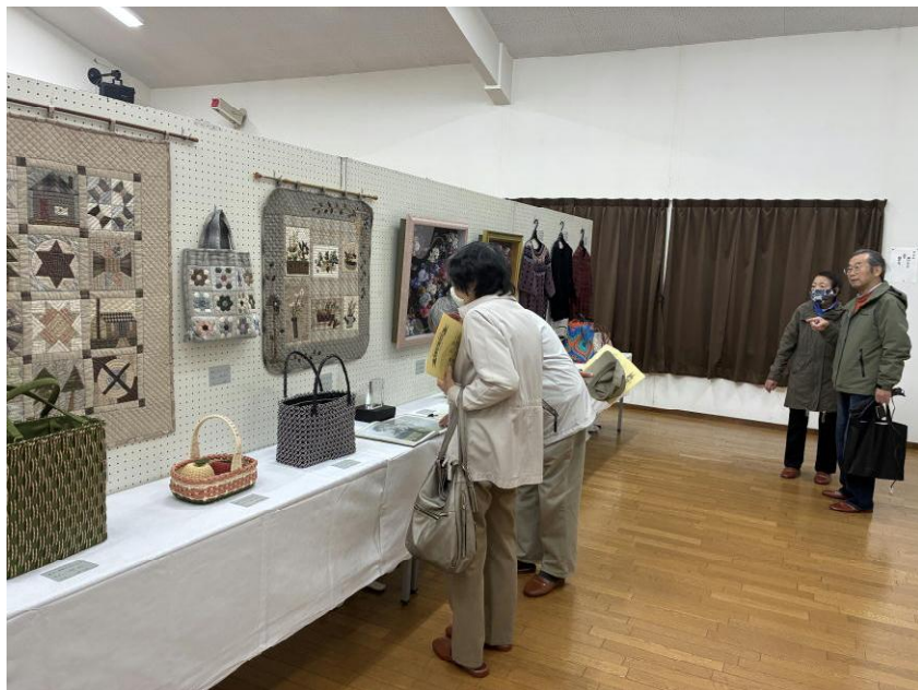
たくさんの作品が寄せられる

ビックニュースを見ながら、自治会で「こんなこともあったねえ」とくつろいでいました。