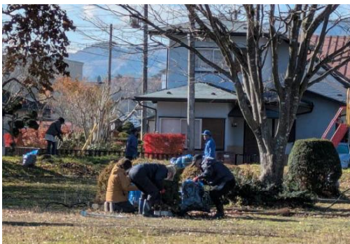
落ち葉清掃（二工区）

これで今年の活動はおしまい。一工区の参加者には1年間ご苦労様でしたとティッシュペーパーが渡されました。公園のトイレも冬の間は閉鎖となります。