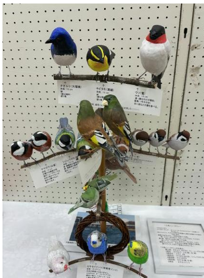
バードカービング