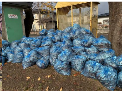
集められた落ち葉80袋（一工区）