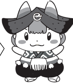
滝沢市ご当地キャラクター「ちゃぐぼん」