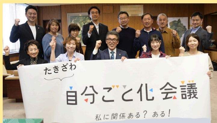
18人のメンバーが参加しました