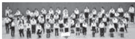
「HAPPY MUSIC」 の合唱をする 篠木小学校

第61回市小学校音楽会が、11月6日に盛岡市民文化ホール（マリオス）にて、開催されました。子どもたちは練習してきた合唱や合奏を、声や体で表現していました。一音一音を大切にしたい美しいハーモニーがホールに響き渡る音楽会となりました。