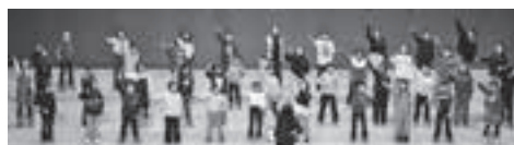
「怪獣のバラード」 の合唱をする 滝沢東小学校