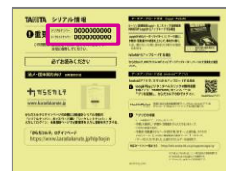
黄色い紙（活動量計の箱に同梱）