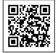
使用可能なスマートフォン