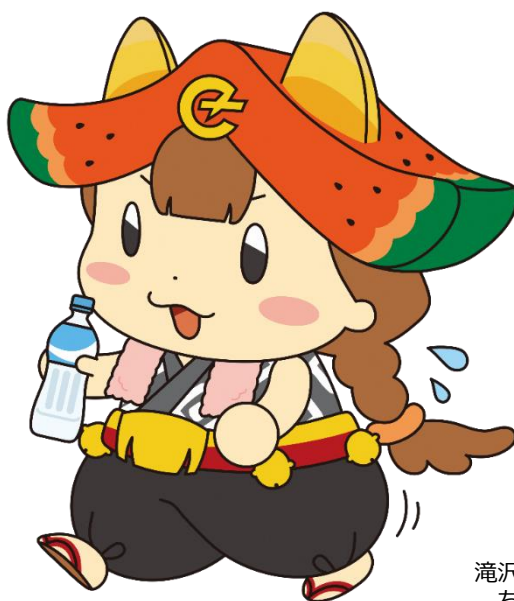
滝沢市営業係長 ちやぐぼん