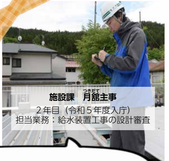
施設課 つきだて 月館主事