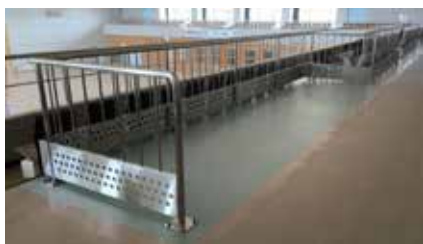
▲車いす用観客席の設置