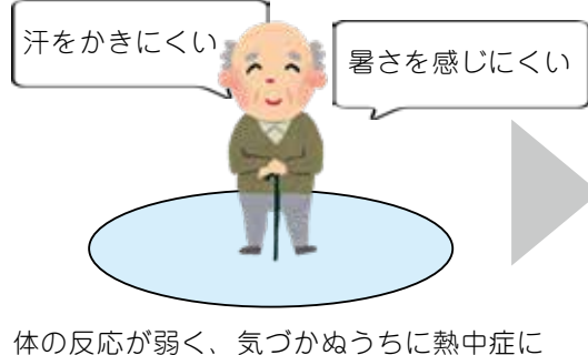
体の反応が弱く、気づかぬうちに熱中症に