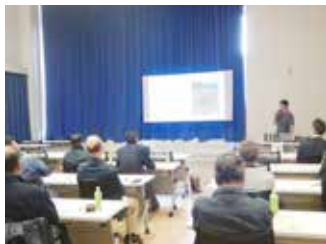
▲認定農業者協議会全体研修会での発表の様子

経歴：滋賀県のワイナリーで8年ほどワイン醸造に従事した後、東京都に拠点を移し、山梨県などでブドウ栽培やワイン製造の知識を深める。