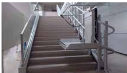
▲階段段差解消機の設置

活用して実施され、アリーナ床の張替えや車いす用観客席の設置、階段段差解消機の設置、多目的駐車場の屋根・通路シェルターの設置を行いました。