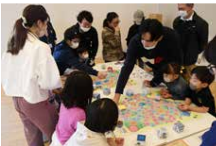
「まちづくりキット」体験会の様子

■鞍掛山の山開き式を取材しました。登ったことのあるコースとは違うコースから登って見たのですが、自分の体力のなさを痛感する結果となりました…。「あと何km」の表示にとっても励まされながら山頂へ。山頂では登山者の皆さんの清々しい笑顔に癒やされ、天気も最高の良い1日になりました。（角掛）