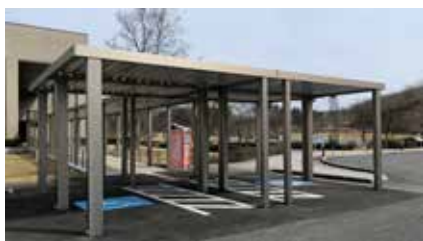
▲多目的駐車場の屋根・通路シェルターの設置

滝沢総合公園体育館改修工事が令和6年2月に完了しました。同工事は、令和4、5年度にかけて防衛省の民生安定助成事業補助金を