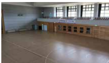
▲アリーナ床の張り替え

滝沢総合公園体育館改修工事が令和6年2月に完了しました。同工事は、令和4、5年度にかけて防衛省の民生安定助成事業補助金を