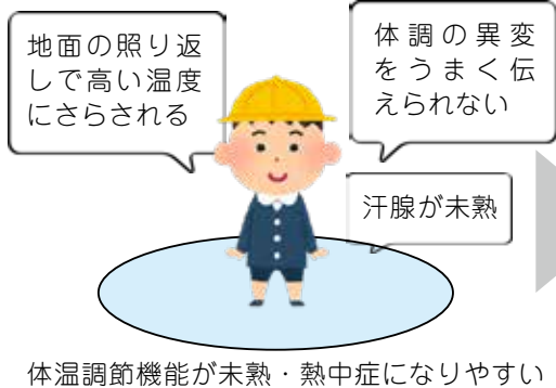
体温調節機能が未熟・熱中症になりやすい