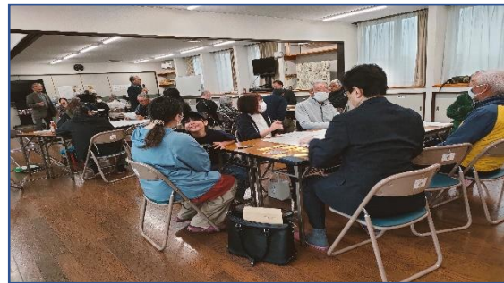
ワークショップでは4グループに分かれて話し合いました。

な課題が出されました。推進委員会では、今後、これらの課題をまとめながら、より良い地域づくりへ反映させていくことにしています。