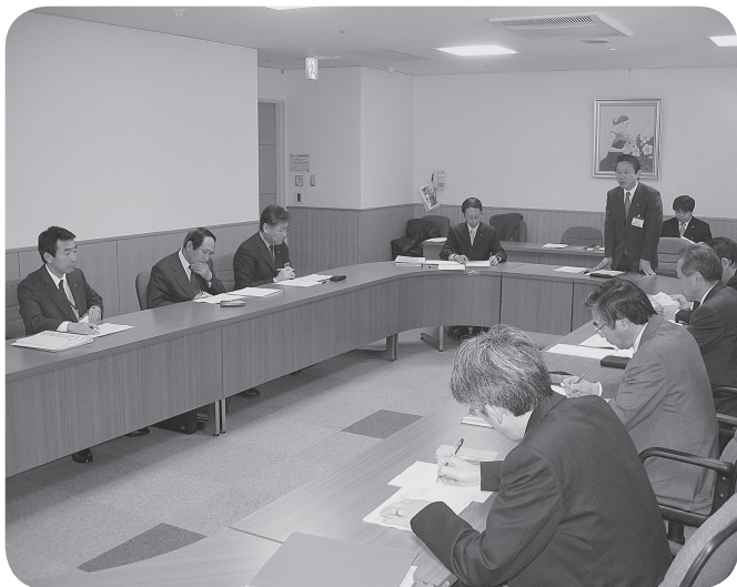
▲広域連携検討会議

Q1 広域市町村圏における連携取り組みの概要は、また、広域課題は多岐にわたっており、単独対応の難しいものや、住民のために本気に「効率化」を図ろうとすれば、これまで以上の思い切った連携取り組みが求められるが、考えは。