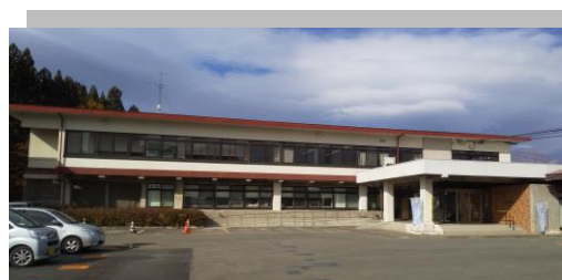
滝沢市役所分庁舎 (旧公民館)