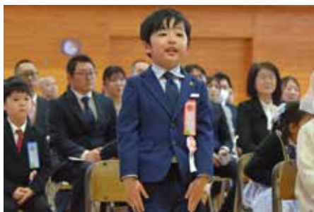
入学式で元気よく返事をする新入生