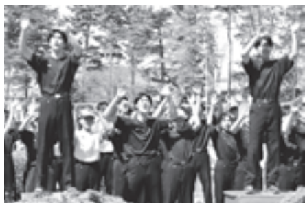
有志応援団による応援を見せた滝沢南中