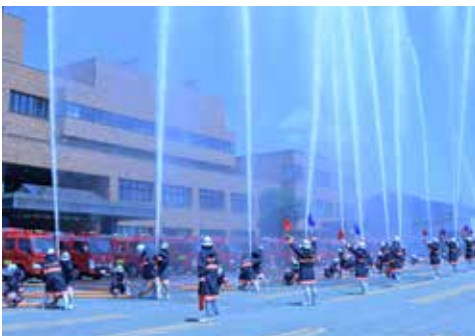
▲一斉放水訓練の様子

[広告] この広告は、広告主の責任において市が掲載しているものです。広告の内容について市が推奨などをするものではありません。