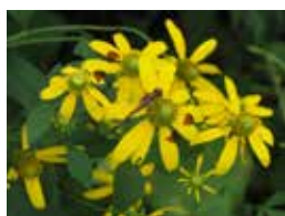
▶オオハンゴンソウ

除草剤の使用は一定の効果がありますが、周囲の植物も枯らしてしまう恐れがあります。使用する際は周辺環境への影響に十分注意してください。