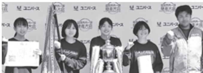
74 チームエントリーで優勝した滝沢中女子チーム