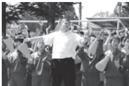
2・3年生が選手を後押しした滝沢第二中