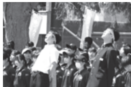
迫力のある全校応援を見せた滝沢中