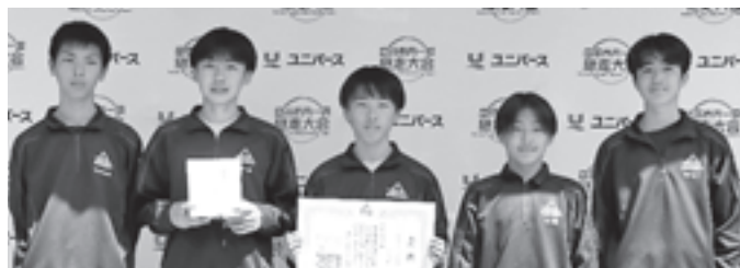
89 チームエントリーで準優勝した滝沢中男子チーム

第79回盛岡市内一周継走大会が4月19日、盛岡市の岩手県営運動公園陸上競技場で開催されました。市内中学校から、男女各3チームが参加。女子の部では滝沢中が優勝し、大会3連覇を果たしました。男子の部でも、滝沢中が2年連続で準優勝となりました。