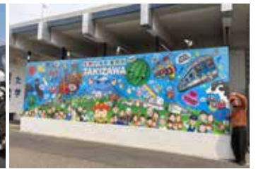
▲滝沢ストリートフェスティバルの様子 ▲TAKI 駅ウォールアートの様子