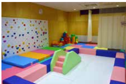
リニューアル後の滝沢総合公園体育館幼児室