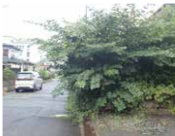
庭木が道路へ越境し通行を阻害している