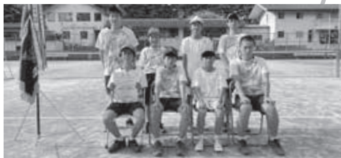
滝沢中男子ソフトテニス部