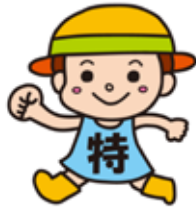
▲特別調査キャラクター とくちゃん