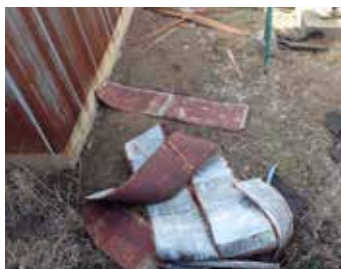
破損した屋根を放置した結果、屋根材が飛散した