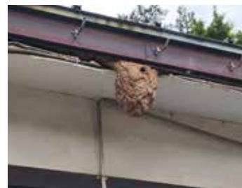
適切な頻度で管理しなかった結果、蜂の巣ができた