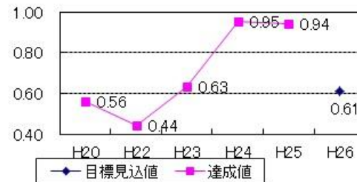
有効求人倍率(盛岡公共職業安定所管内)