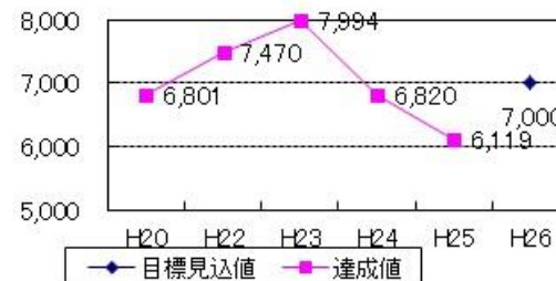
滝沢市地域職業相談室の紹介件数