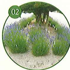
街路樹の足元にラベンダー。 ハーブの香りを楽しむ街づくり ▶平成20年度 日本アロマ環境協会賞受賞