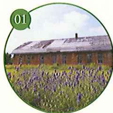
「香りとさえずりの杜」 野鳥の集まる市民の憩いの場所へ ▶平成19年度 環境大臣賞受賞

コンテストは、今年度で7回目をむかえます。毎年多彩なアイデアが満載。募集企画のイメージと、過去の受賞例の一部をご紹介します。