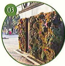
公園施設を壁面緑化。 植物の香りで癒しとくつろぎを提供 ▶平成19年度 におい・かおり環境協会賞受賞