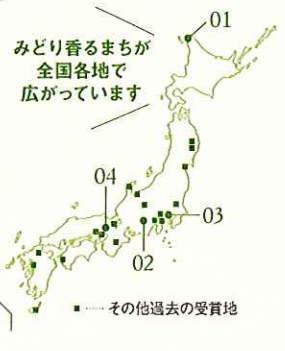
みどり香るまちが全国各地で広がっています