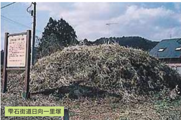
雫石街道日向一里塚