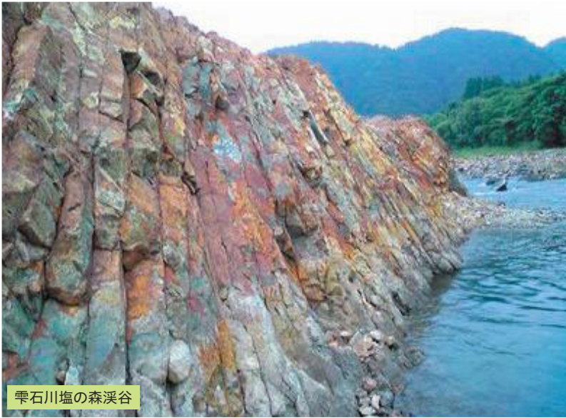
雫石川塩の森溪谷

私たちの地域には、自然・歴史・文化に育まれた伝統芸能・食文化・景観・自然環境など、みんなで守り育て、次の世代に継承したい宝物があります。