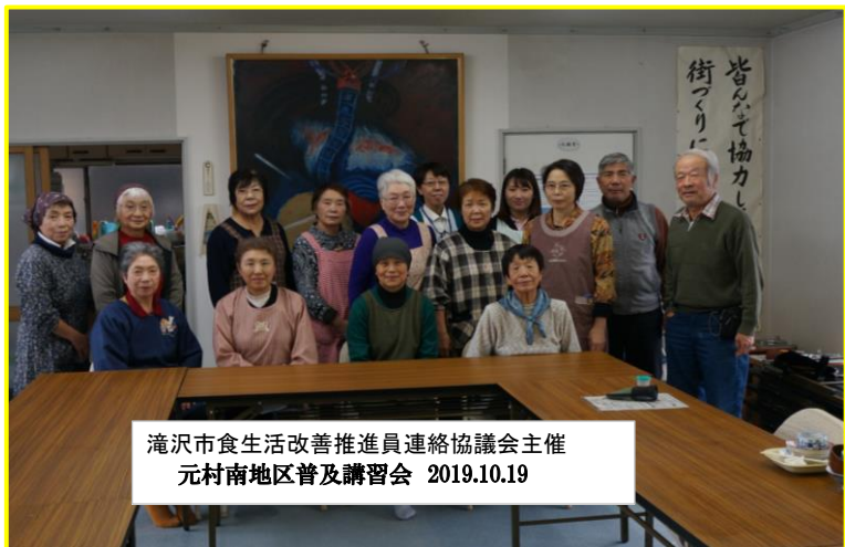
滝沢市食生活改善推進員連絡協議会主催 元村南地区普及講習会 2019.10.19

今年もみたけ学園、みたけ支援学校の協力も得て開催されました。文化部等関係者の皆さんご苦勞様でした。