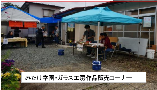
みたけ学園・ガラス工房作品販売コーナー