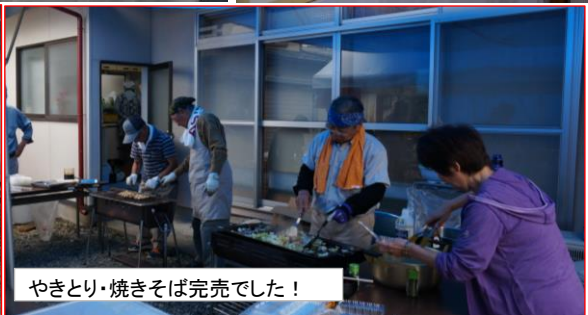
やきとり・焼きそば完売でした！

今年もみたけ学園、みたけ支援学校の協力も得て開催されました。文化部等関係者の皆さんご苦勞様でした。