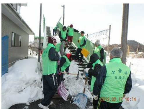
スノーバスターズ