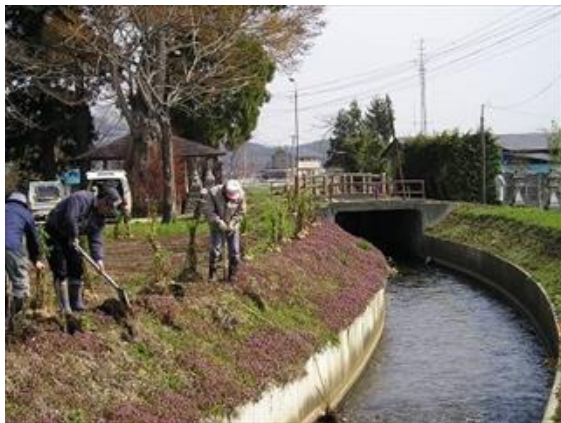
H19 越前堰土地改良区とアドプト協定締結