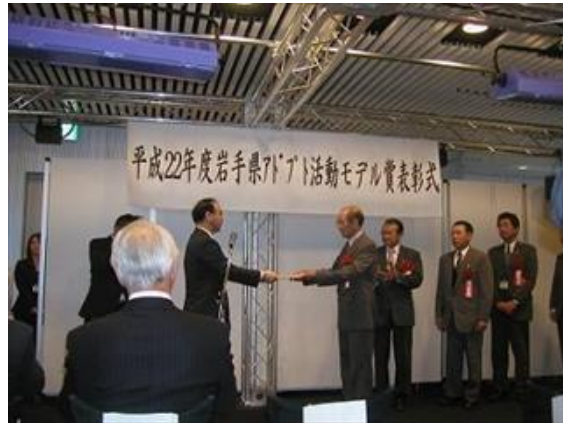
H22 岩手県アドプト活動モデル賞受賞