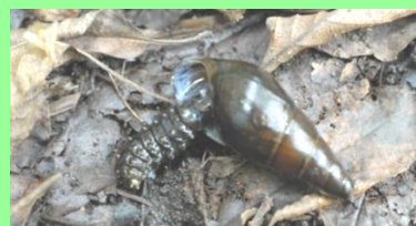
カワニナを食べる幼虫