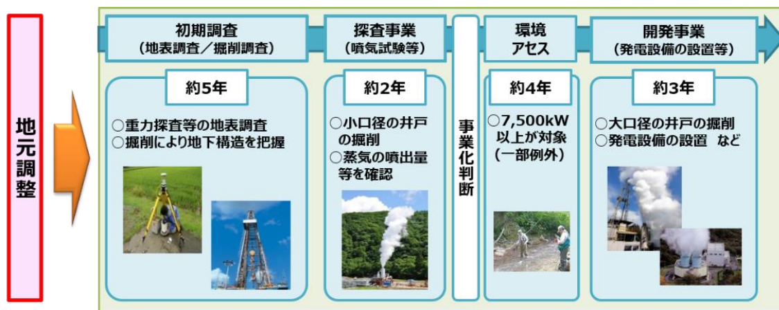
図 地熱発電事業の一般的な開発プロセス

※環境影響評価法（平成9年法律第81号）に基づく環境アセスメント手続については、前倒環境調査を適切に実施した場合には、短縮が見込まれている。また、井戸の掘削期間の短縮化に向けた技術開発なども行われている。