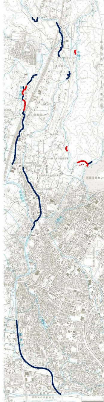
木賊川・巣子川・諸葛川・市兵衛川

図: 滝沢市におけるカワシンジュガイの分布 赤いラインで示した河川において、生息が確認されている。