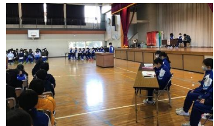
【活発に意見を出し合った児童総会】