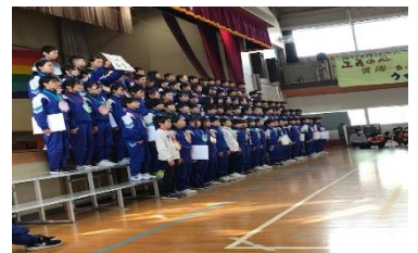
【もうすぐお別れ6年生】