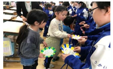
【ペンダントを渡す1年生】

2月22日(木)、全校が一堂に会して6年生を送る会を開催しました。それに先だって、1年生が6年教室に出向き、ペンダントのプレゼントをわたしました。たくさん6年生にお世話になった1年生も「ありがとうございます」の気持ちを伝え、照れくさそうに受け取っている6年生の姿が印象的でした。当日の各学年からの発表は、6年生への感謝の気持ちをダンスや歌・合奏、寸劇、呼びかけなどにのせて伝えました。各学年の発表に6年生は大喜びで、一緒に踊る場面もありました。そして、最後に6年生から各学年に贈る言葉をもらい、どの学年も6年生との思い出を辿りながらしみりとしていました。また、6年生の合唱「いのちの歌」には胸がいっぱいになりました。これまで鶺鴒小学校の中心となって頑張ってくれた6年生のみなさん、中学校での活躍を祈っています。