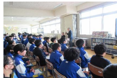
【真剣な表情の6年生】