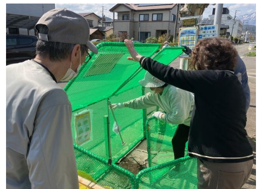
カラスいけいけの使い方を説明

令和4年度予算で組み立て式ゴミ箱（カラスいけいけ）を3基購入できたことから、4月20日に青空ごみ集積所3工区No.5と2工区No.10にカラスいけいけを設置しました。