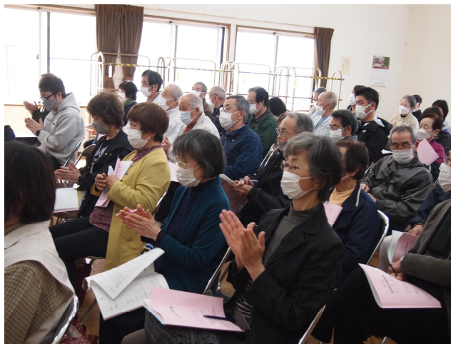
拍手で承認される