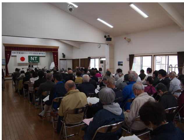
たくさんの参加者