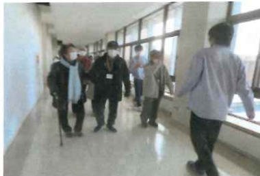
広いなあ・・・いい運動にはなるよ