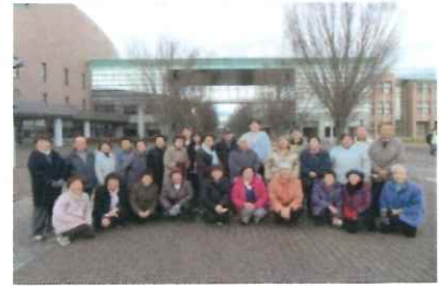
県立大学生になった気分です