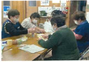
みんなで願いを込めて作りました。

保健部では八十歳以上の皆さまに好評のクリスマスカードを作り、12月24日各ご家庭に届けました。思いがけない贈り物にほっこりした気持ちになったと喜びの声が聴かれました。