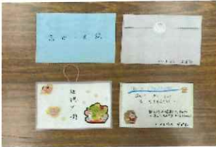
メッセージカードです。