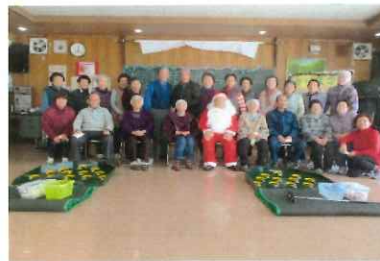
来サンタも来てね