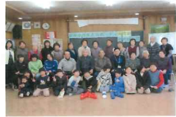
はい、ポーズで思わずにっこり