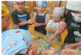
まーるくまーるくな〜れ