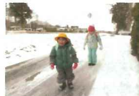
すべるよ～と一年生