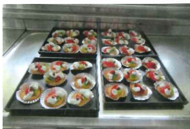
食べるのがもったいないミニケーキ

百寿会では打ち収めのスカットボール交流会を12月21日に行いました。クリスマスソングにあわせ大きな袋を肩にサンタクロースが登場、沢山のお菓子をいただきみんな大満足、サンタさんから「1年間ご協力ありがとう」・・・と。ミニケーキを食べながら今年も楽しい時間を過ごしました。