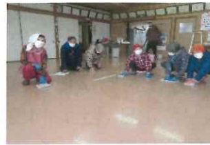
久々にみんなで雑巾がけです。