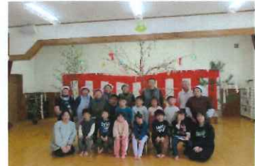
みんなでハイ、ポーズ