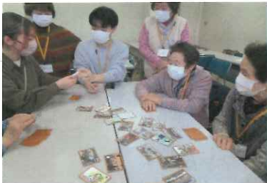
カルタ読み手の学生は英語より難しいと

7人の学生たちが笑顔で出迎えてくれ、広大な敷地と広々としたキャンパスを、大学生になったようないい気分になり、長い廊下も学生たちがゆっくり優しく語りくれるので、苦にならず楽しく歩く事が出来ました。世代間交流では「大沢カルタ」で遊びましたが、昔の言葉で楽しみ大いに盛り上がり大学と学生に親しみが沸き、いい時間を過ごしました。机に向かい勉強するばかりでなく色々な体験をしながら人間形成をしていくのが大学生かなあと感じ、心の栄養になった一日でした。