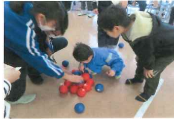
赤かったかな・・・真剣な眼差しで