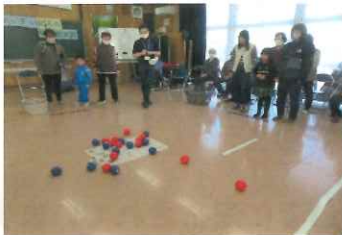
子どもも大人も勝ったのはどっち

小学生とのポッチャ交流会を社会福祉協議会の協力もあり初めて1月11日の午後から行いました。冬休みが終わった直後であり、少々心配しましたが3名のママたちの協力もあり総勢40名の参加でした。自治会長の挨拶後、祖父母の名前入りの自己紹介があり、より親密感が湧きました。社協の晴山氏独自のポッチャは勝ち負けにこだわらず、笑い声が絶えないポッチャでした。