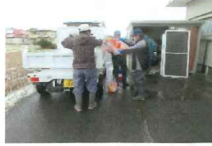
倉庫の中も整理整頓

使用頻度の高い集落センターの大掃除を12月17日、自治会と使用団体合同で行いました。大勢の方々のご協力によりセンターの隅々まで綺麗に掃除・整理され、新年を迎えることができました。ご協力ありがとうございました。