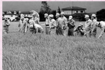
▲冷害対策特別委員会による農作物被害調査(平成5年10月5日)

平成5年はずかたつてない冷害となり、村全体に深刻な影響を与えた。村議会は早速、特別委員会を設置し調査活動を開始。村当局もその報告を受けて、被害農家の救済に万全を期した。