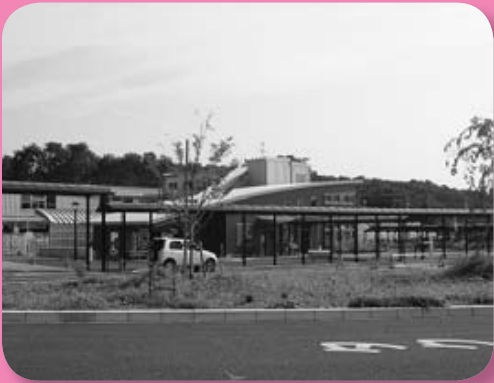
栄子駅地区まちづくり事業