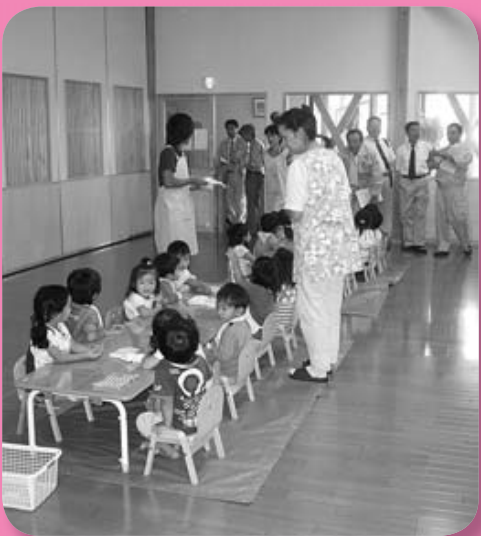
児童厚生施設整備事業(なでしこ保育園)

全員協議会では9月14日に決算 審査特別委員会の審査に先だち重 点事業の現地調査を行いました。