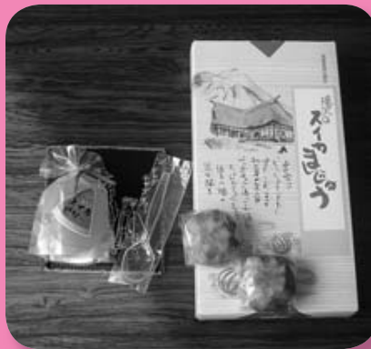
特産品開発関係事業