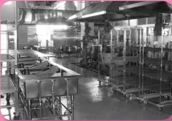
学校給食施設改善事業