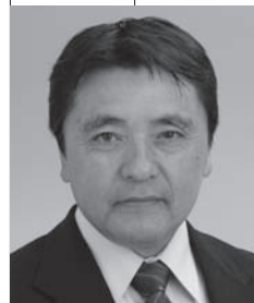
桜井 博義 議員

その中で就労支援セミナー等の参加、アンケート調査を行ってまいります。また、一般企業向けリーフレット作成など一般就労へ結びつくよう関係機関と連携を図っていきます。