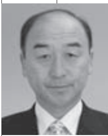
日向 清一 議員（春緑クラブ）

豊かで潤いのある生活環境の実現のため芸術文化関係団体の活動と基盤強化を支援します。また、活動の成果を発表し、鑑賞の機会を提供していきます。