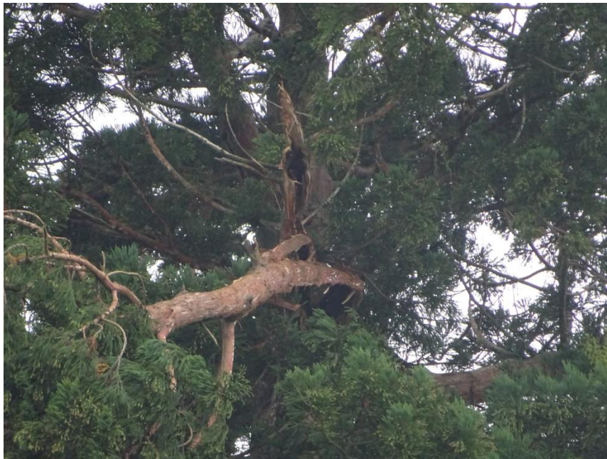
台風19号被害状況 (令和元年10月14日(日)撮影)