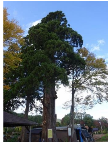
写真2 作業完了 (10月24日撮影)