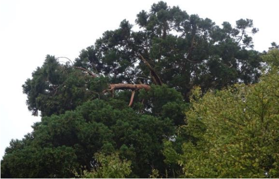
写真1 被害状況 (10月14日撮影)