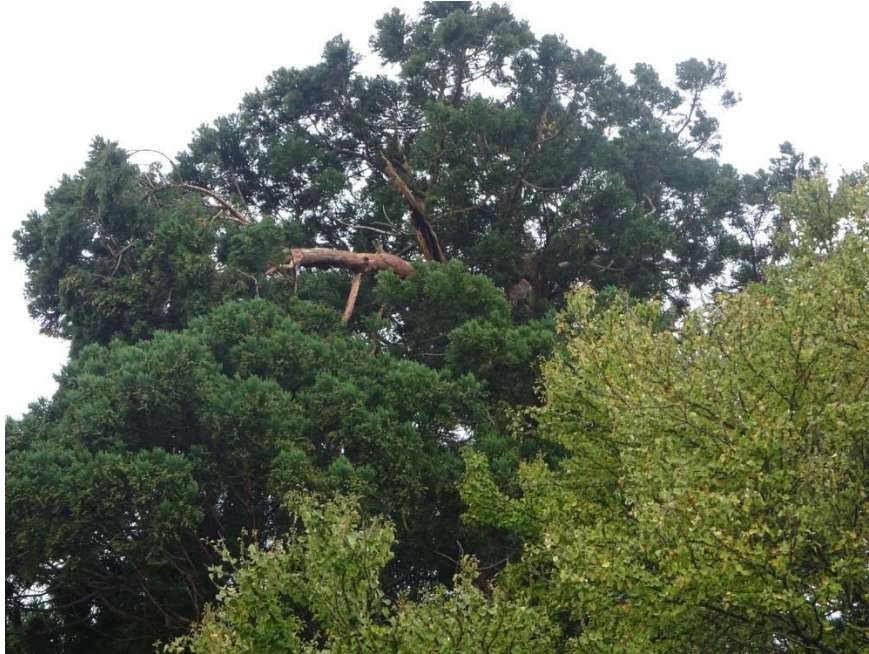
台風19号被害状況 (令和元年10月14日(日)撮影)