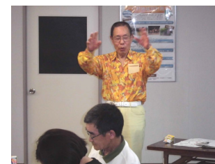
講評をいただきました

お忙しい中「ワークショップ」へご参加頂きました皆さま、大変有難うございました。色々な意見、沢山のアイデアが出されました。今後、市民皆さまと、市役所の「協働」の大きなテーマになる「家庭ごみ減量化」にとって、推進への指針となる「ひとつひとつ」と考えております。今後とも、宜しくお願いいたします。