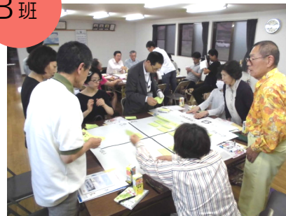
グループ発表の準備中