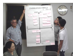
C班が発表しました