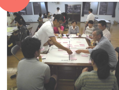
実現性と効果を軸に分類中