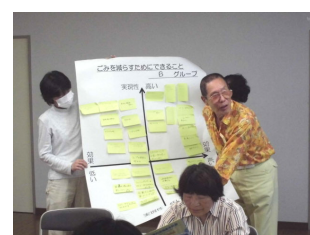
B班が発表しました