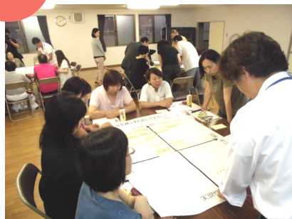
お互いのアイデアを披露しています。