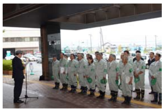
▲出発式で市長が激励

農地流動化推進検討会議(南部地区)を開催 昨年12月、市多目的研修センターで、担い手への農地の集積・集約化について話し合われました。参加したのは、市農業委員や南部地区の農家組合、地区の担い手など約60人。 地区ごとに図面を見ながら耕作者を確認するなど、現状を把握し、問題点を整理しました。参加者からは「誰がどこを耕作しているのか今初めて分かった。農地の集約化には難しい問題もある。組織的な取り組みの必要性を感じた」などの意見が出されました。 高齢化による離農や後継者不足など農業を取り巻く環境