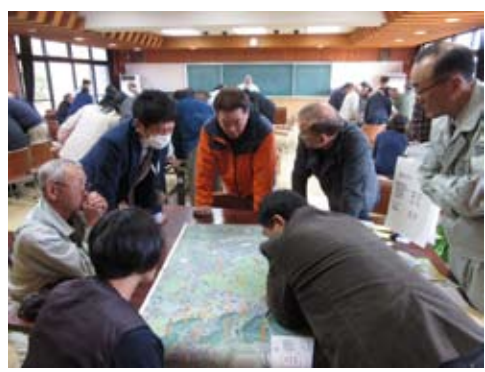
▲図面を見ながら地域の課題を整理

農地流動化推進検討会議(南部地区)を開催 昨年12月、市多目的研修センターで、担い手への農地の集積・集約化について話し合われました。参加したのは、市農業委員や南部地区の農家組合、地区の担い手など約60人。 地区ごとに図面を見ながら耕作者を確認するなど、現状を把握し、問題点を整理しました。参加者からは「誰がどこを耕作しているのか今初めて分かった。農地の集約化には難しい問題もある。組織的な取り組みの必要性を感じた」などの意見が出されました。 高齢化による離農や後継者不足など農業を取り巻く環境