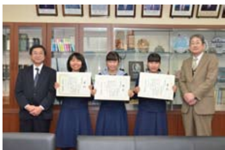
税に関する書写展で滝中生徒が最高賞に

市特別表彰では、市体育協会表彰式では市内各種スポーツ団体の表彰が行われ、会場からは大きな拍手が送られました。