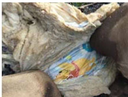
▲おむつはトイレに流せません 詰まった紙おむつをグローブで押さえ撮影

トイレや台所に、絶対に異物を流さないでください。「1回だけなら」「私だけなら」という身勝手な考えが、重大な事態を引き起こします。皆さんの配慮で下水道が守られ、長く安心して使用することができません。最悪の事態を防ぐためにも下水道は正しく使しましょう。