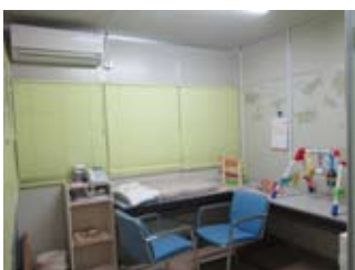
▲相談室は、相談や授乳、おむつ替えにも利用できます。