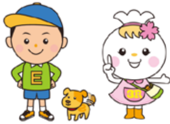
愛犬の ごみカン太 ボトル エコロール