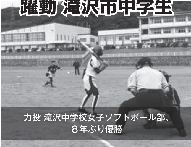
力投 滝沢中学校女子ソフトボール部、 8年ぶり優勝

6月16～17日の2日間にわたり、岩手地区中学校総合体育大会が開催されました。市内各中学校の健闘の結果、団体戦地区優勝は11チーム（平成29年度は10チーム）、準優勝に8チーム（同じく9チーム）が入賞。ことしも大活躍でした。中学校の集大成となる本大会。部員一人一人の熱い思いのこもった熱戦が繰り上げられました。