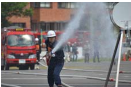
消防団員に憧れる若者が増えてほしい