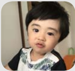
なかはな あると 中花 或杜 くん H27.9.20生 3歳