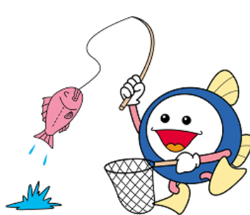
下水道キャラクター スイスイ

くみ取便所を水洗便所に改造する場合、市が金融機関に資金の融資をあつせんし、利子を負担する制度があります。この制度は、公共下水道、浄化槽どちらの水洗化にも利用できます。お気軽にご相談ください。