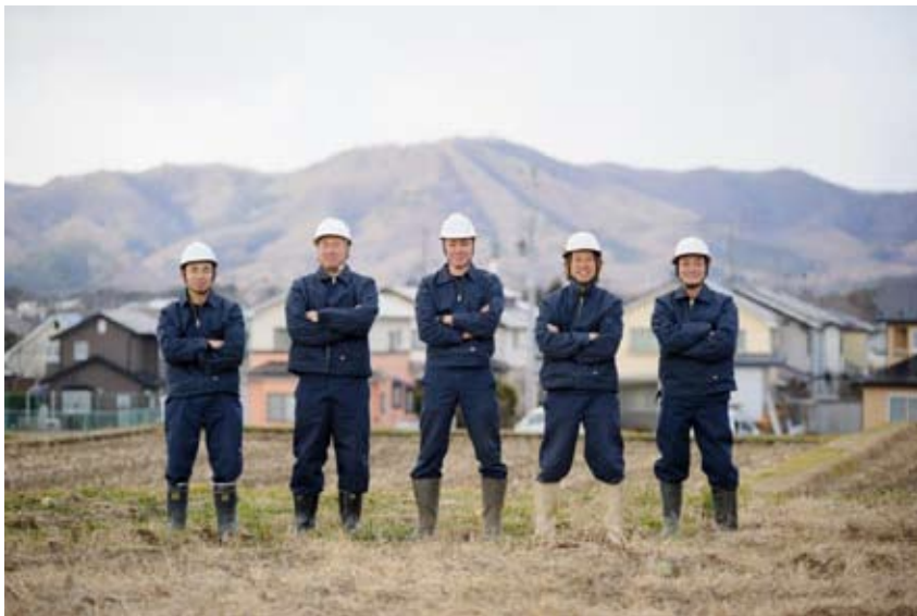
経験を問わず、やる気に満ち溢れた若者を募集しています