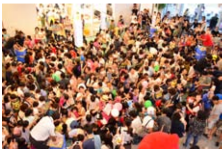
お菓子まきは大盛況でした

■暑い！現在、外の気温は34度。この暑さはいつまで続くんでしょう。例年、夜寝るときは窓を開けエアコンを使わないのですが、今年はそうはいきませんでした。皆さん熱中症にはお気を付けてください。水分補給にはみずみずしい滝沢スイカがオススメです。（菅野）