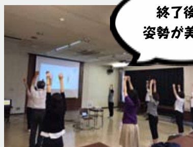
▲正しいラジオ体操講習会