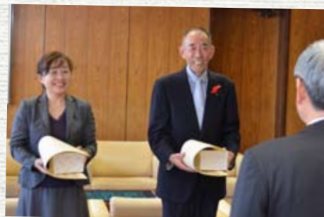
市長から感謝とエール

11月15日に表彰状の伝達式が市長室で執り行われ、県人権擁護課の職員から表彰状が手渡されました。主演さんは「今までの感謝とともに、これからも活動を頑張っていきたい。市内の子どもたちには人権の考えが浸透しているが、さらに高めていきたい」と今後の抱負を話しました。