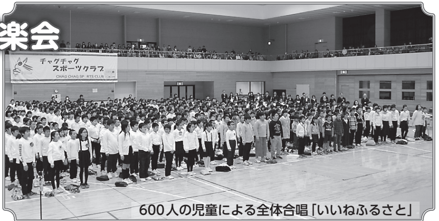
600人の児童による全体合唱「いいねふるさと」

開会行事では市愛唱歌「いいねふるさと」を全体合唱。どの学校も素敵な合唱や合奏を多くの観衆で埋まる体育館いっぱいに響かせました。