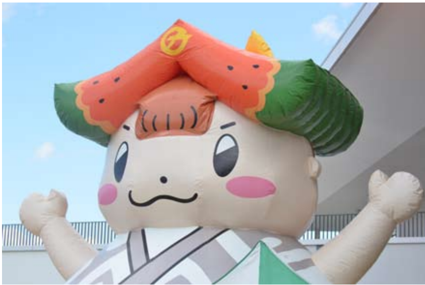
ちゃぐぼんのふわふわはイベントで子どもたちに大人気です