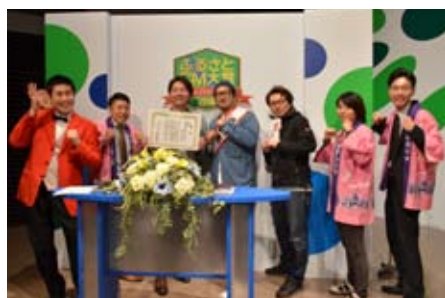
みごと滝沢市が銀賞を受賞