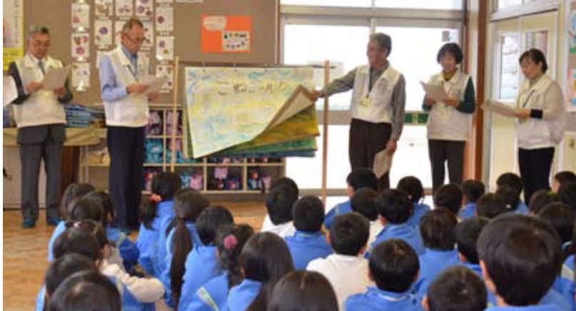
▲実話をもとに先輩が手作りした大型紙芝居を大切に使い続けています

人権に「難しい」「固い」「別世界」なんてイメージをお持ちではありませんか？決してひとつごとではありません。実はとても身近な問題です。気付かないうちに加害者になっているかも！