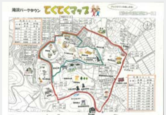
▲てくてくマップ(総合公園周回コース)