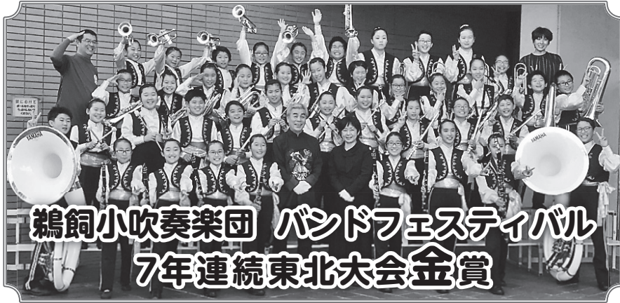
鵜飼小吹奏楽団 バンドフェスティバル 7年連続東北大会金賞

第37回全日本小学校バンドフェスティバル東北大会が10月28日、仙台市で開催され鵜飼小学校吹奏楽団が金賞に輝きました。