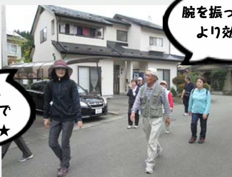
▲ウォーキングの様子

週末のプチ旅行でも良いリフレッシュになります。大自然に感動したり、地元のグルメを堪能したり、普段できない体験を楽しんで英気を養いましょう。