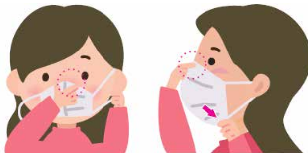
① 鼻の形に合わせ すき間をふさぐ