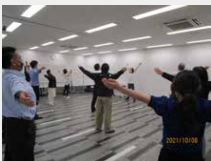
市の出前講座を利用し、社内で実施したラジオ体操講習会の様子

また、ピーぷるでは、事業所を対象とした1週間スモールチャレンジ事業に毎年参加するなど、健康づくりの取り組みを積極的に実施しています。一人ではなかなかできなくても、会社全体で実施することで、運動する習慣ができることは素晴らしいですね。