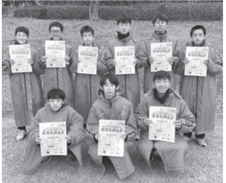
【滝沢中男子駅伝部のメンバー】

滝沢中男子チームの全国大会での活躍は、岩手の中学校駅伝の歴史を塗り替えるすばらしい功績となりました。