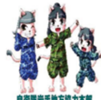
自衛隊若手地方協力本部