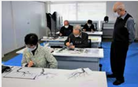
教養講座と多彩な 28 教室を開催します 皆さんの参加をお待ちしています

・月曜日と金曜日開催の講座は、通学に市の福祉バスを利用できます。 ・睦大学対象者の要件を備えていれば、申し込みにより入学することが出来ます。 ・あらためて入学許可の通知はしません。 ・ご了承ください。