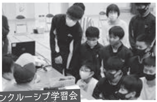
インクルーシブ学習会 「であい授業」

障がいを持ちながらアート作品をデザインしている講師を招き、インクルーシブ学習会を開催しました。講師の人生経験や大切な人との絆について知り、障がいも個性の一つであるとの理解を深めることができました。