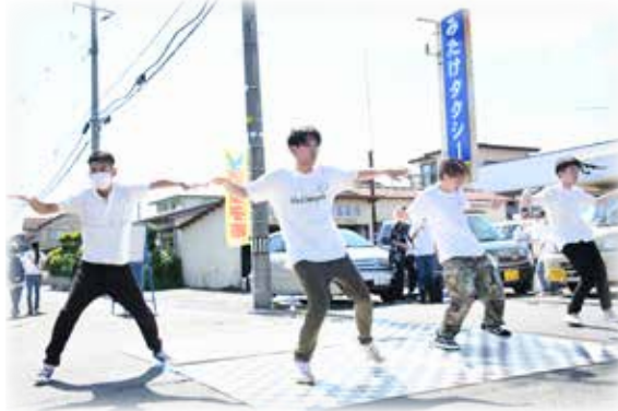
△鷹巣子市ではダンスやダブルダッチで会場を盛り上げました。