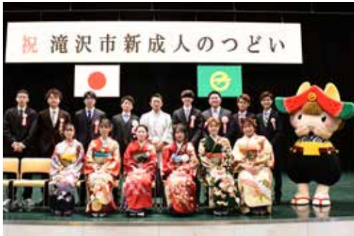
▲令和4年対象の新成人のつどい実行委員の皆さん