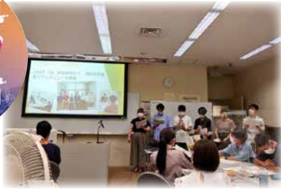
△実習で得た気づきや学びを発表します。

実習では、地域の皆さんや市職員との交流から、市の特徴や課題について学生が気づきを得ていきます。本年度は「学生の力を生かすまちづくり」がテーマ。地域活動への参加促進を課題に選んだ学生は、大学のサークルと一緒に調査や実践活動を展開。巣子地域のイベント「鷹巣子市」に出演し会場を盛り上げるなど、楽しみながら実習に取り組みました。