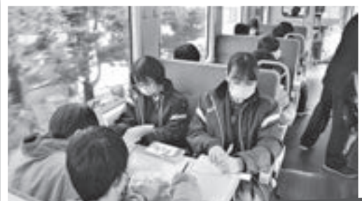
いわての復興教育 いきる・かかわる・そなえる ～被災地訪問学習～

復興教育の一環として1年生全員が復興列車に乗車し、被災地の現状や復興の取り組みについて学びました。生徒は震災の教訓などを語り継いでいきたいと決意し、自分には何ができるかを考える良い機会となりました。