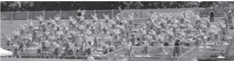
一体感のある陣地での応援