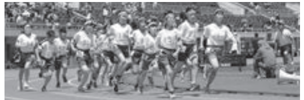
6年女子800m スタート直後の選手たち