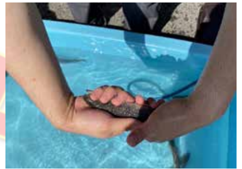
📍 ひんやり！イワナのつかみ取り

た、今回初めてイワナに触り、食べる体験をした。このような体験が地域の物を地域の者が認識するきっかけになると感じた」と話しました。 鷹巣子市の調査を通じ、運営している人と参加者の間に垣根がなく「地域のつながり」の強さを感じました。 参加者が増えるのとよりイベントにもぎやかにあります。皆さんも気になるイベントがあればぜひ参加してみてください！