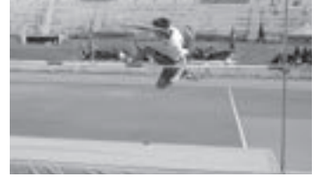
記録に挑戦する選手

第74回滝沢市小学校陸上記録会が7月7日（木）、県営運動公園陸上競技場で開催されました。