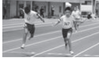
ゴール前で競り合う選手