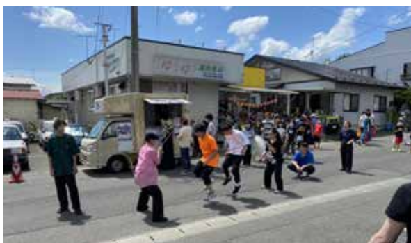
📍 「ROPE A DOPE」の華麗な演技

た、今回初めてイワナに触り、食べる体験をした。このような体験が地域の物を地域の者が認識するきっかけになると感じた」と話しました。 鷹巣子市の調査を通じ、運営している人と参加者の間に垣根がなく「地域のつながり」の強さを感じました。 参加者が増えるのとよりイベントにもぎやかにあります。皆さんも気になるイベントがあればぜひ参加してみてください！