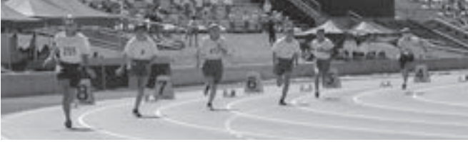
大会新記録が生まれた6年女子200m