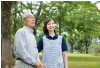
▶ 問い合わせ 市地域包括支援センター ☎ 656-6523

「顔や体にあざがある」「顔色が悪く痩せてきた」「怒鳴り声が聞こえる」「高齢者の介護で疲労やストレスが溜まっているのではないか」など、少しの「サイン」に気付いたら、相談してください。相談・通報者の個人情報 は保護されます。