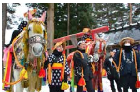
人と馬コと一緒に迎える新年

昨年7月、東京都内で開催された、令和4年度郷土民謡民舞青少年みんよう全国大会民謡チャンピオンの部で優勝しました。