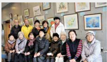
教養講座と多彩な 28 教室を開催します 皆さんの参加を待っています