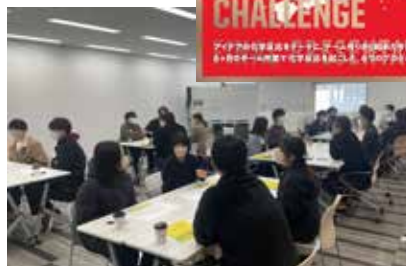
△プロジェクトの1つ「学生カフェ」の様子