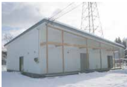
▲新たに整備した室小路公民館