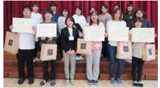
▲最優秀賞の南巣子保育園の皆さん