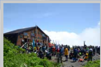
約100人を収容できる八合目避難小屋。目の前の湧水「御成清水(おなりしみず)」で喉を潤すこともできる。水枯れには要注意。

滝沢市と八幡平市、栗石町の3つの登山口で、登山者の安全を祈願する神事と山開き式を開催します。終了後は一斉に登山を開始。3市町がそれぞれの旗を掲げて頂上を目指します。