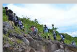
森林の中を歩く新道と開けたガレ場の旧道に分かれる。2.5合目に分岐があり、その後も所々、連絡道で行き来できる。