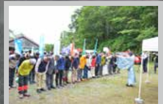
各登山口で午前6時から安全祈願神事と山開き式を開催。