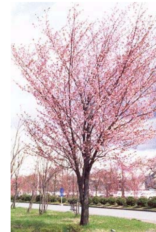
ベニヤマザクラ（村の木） 花 4月頃 落葉広葉樹