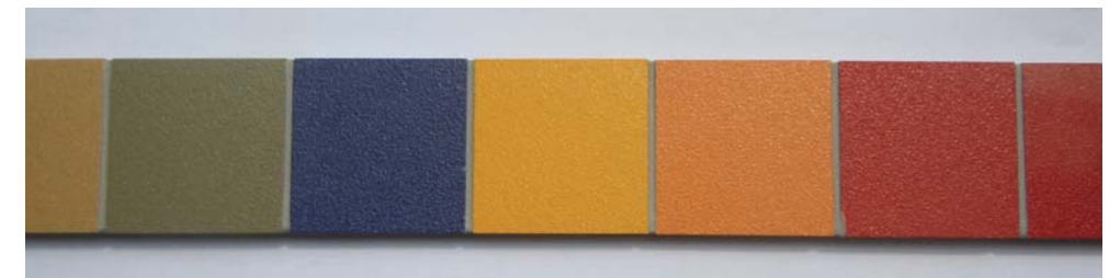
ちやぐちやぐカラータイルイメージ