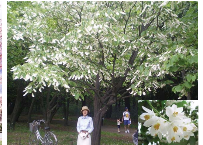
ハクウンボク 花 6月頃 落葉広葉樹