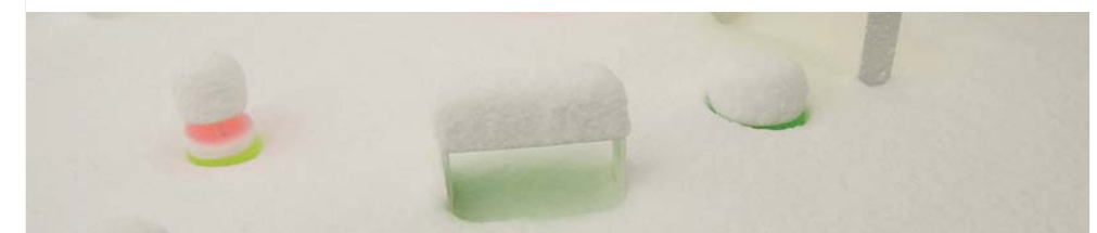
反射光を使ったファニチャーイメージ