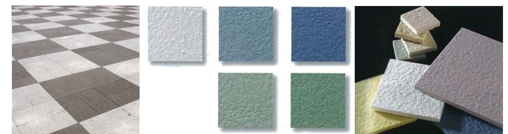
ちやぐちやぐさがりぎれ インターロッキング イメージ