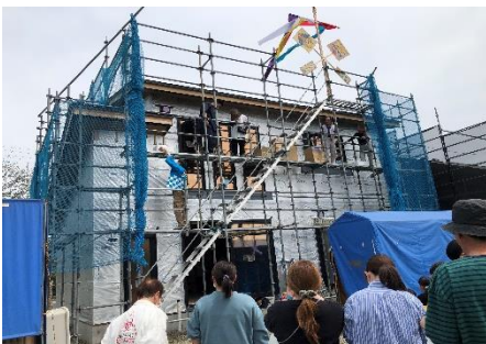
地域の皆さん、よろしくお願いします