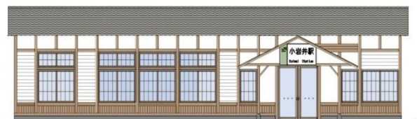
建設当時の外観に模様替えします

小岩井駅の整備が着々と進んでいます。広場の整備に続き、駐輪場、トイレも清潔で明るい施設に生まれ変わりました。5年度は、いよいよ駅舎の改修工事に着工。駅舎の外観は、「国登録有形文化財」への登録を目指して建設時代に近いものとし、待合室のリニューアル、外壁塗装、屋根の吹き替えなどを予定。今年度中にJR東日本が整備し、完成後に滝沢市へ無償譲渡される予定となっています。