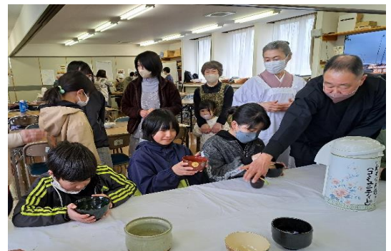
姿勢を正して、「お点前頂戴いたします。」