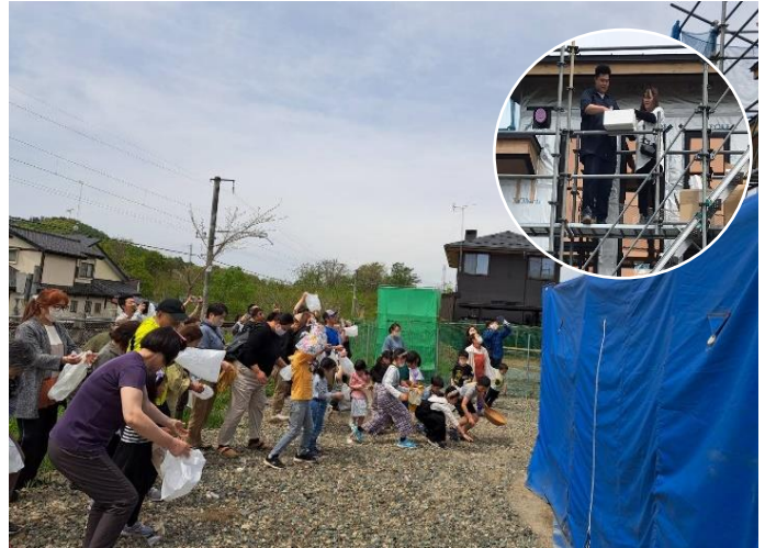
懐かしい餅まき。子供のころを思い出しました

昔を思い出すような懐かしい慣習に、小岩井地域の良さを再発見したような気持でした。