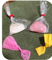
ふるまわれた紅白の餅