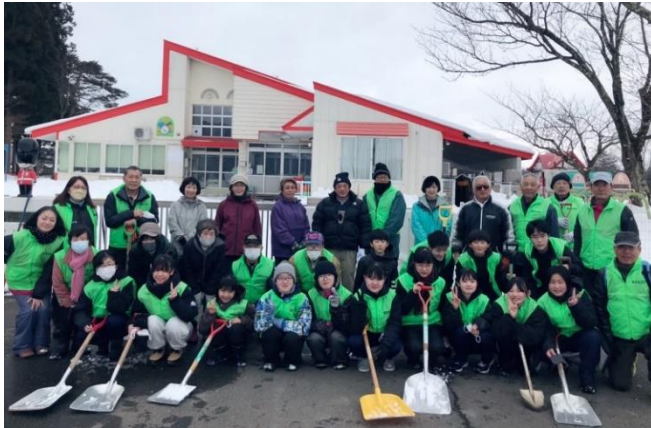
雪かきで汗を流した後は全員笑顔でハイ！チーズ

一般のスノーバスターズは12月10日(土)に打ち合わせ会を行い、独居高齢者等対象者宅の雪かき作業を行っています。中学生のスノー