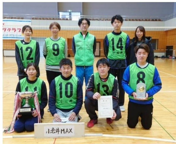
小岩井地区選抜チームの皆さん