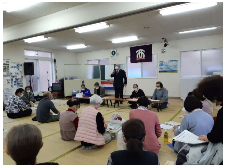
【新旧班長引継ぎ会の様子】