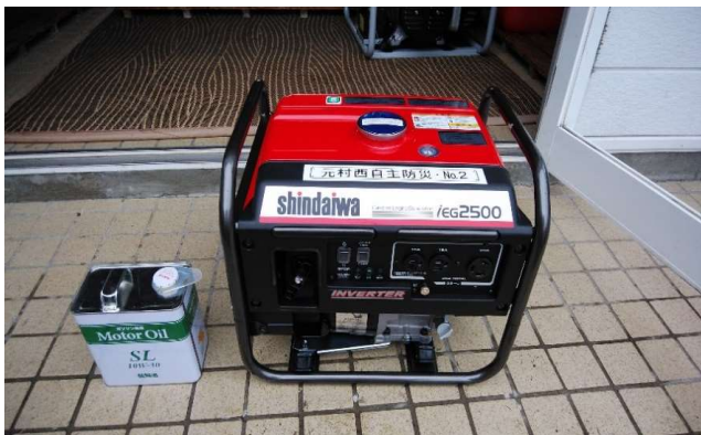
No.2小型発電機(单相100・25kVA)

(けやきの平公民館・外山公民館緊急停電時等対応) 4/3納品になりました。災害時安心して、電気が使えるようになります。どちらもインバーター対応タイプですので、市販の電化製品も安全に使用できます又移動可能なタイプですので持ち運びは可能、災害時の強い味方です。