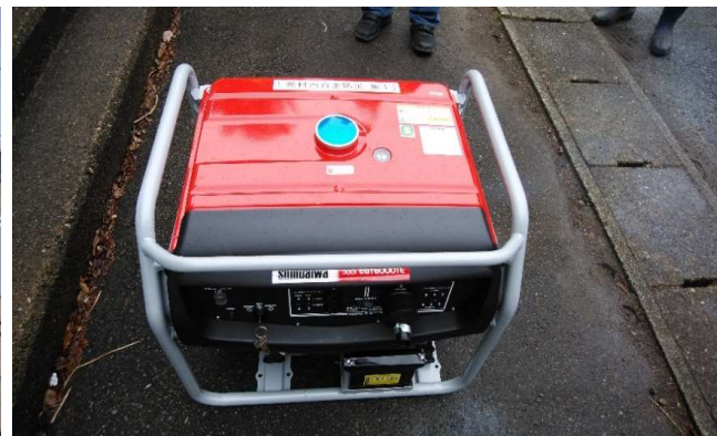
No.1三相発電機(三相200/单相100・30kVA)