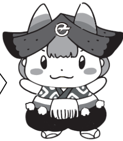
滝沢市ご当地キャラクター「ちゃぐぼん」