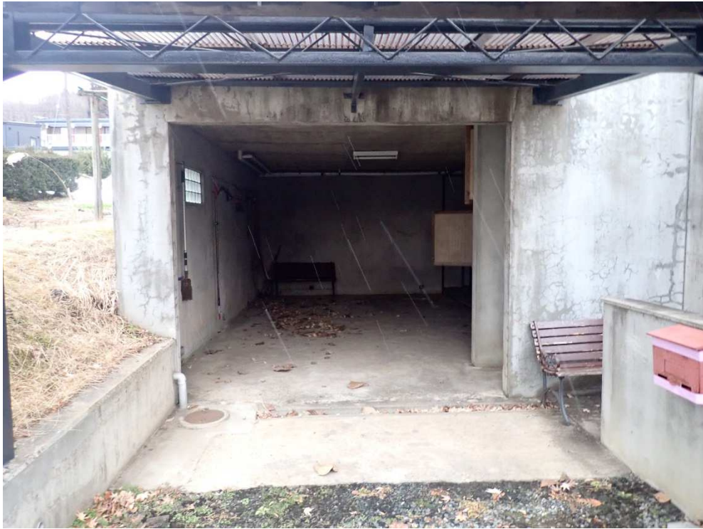
ビルトインガレージ内部収納