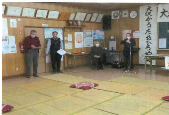
感謝の言葉を述べる自治会長