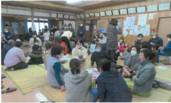
お互いに譲り合いのババ抜き