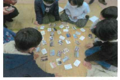
入学前の子ども達も真剣です ビッキたち 夜は静かに 寝かせてケロ このかるた 世界で一つの 宝物