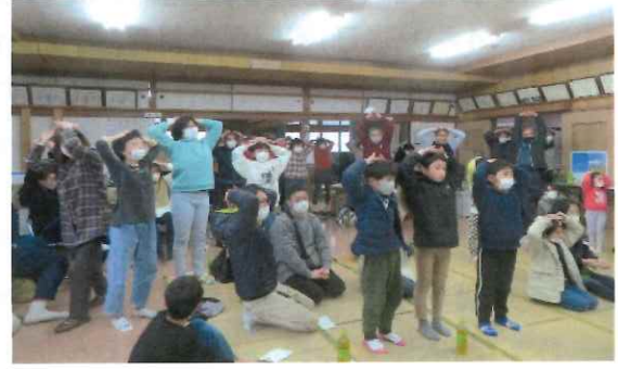
頭を使った後は体操でリラックス