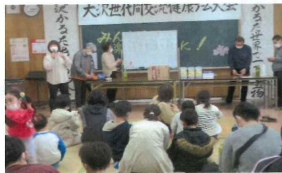
お楽しみビンゴ大会です