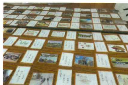
出来上がった読み札と絵札 ランドセル 色とりどりの 花が咲く 三百年 大沢につづく 田植え踊り