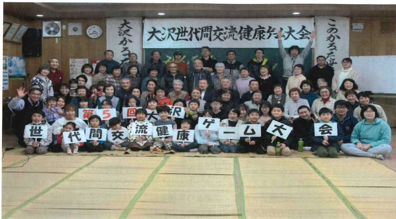
みんなにここにこ 笑顔が素晴らしい!! 参加者は90名でした