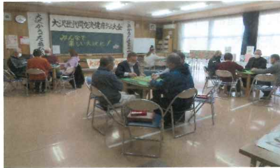
麻雀は結構頭を使います エヘヘ