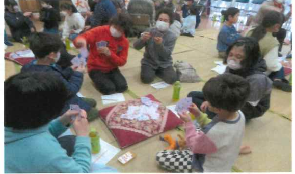
誰がババ持っているの？・・・