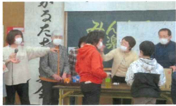
早くもビンゴができました!!