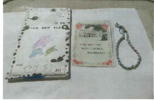
1年生のメッセージと朝顔の種