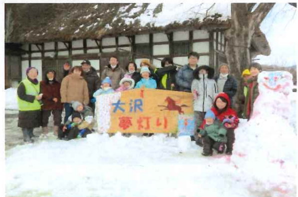
楽しく夢灯りをたくさん作りみんなの 幸せをお願いしました。