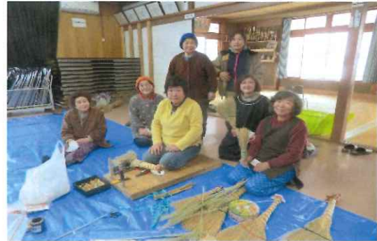
できた箒を手に・・・にっこりと