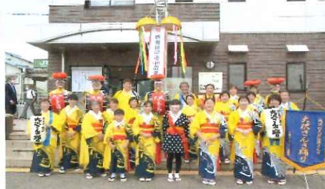
橋場線100周年記念時 大沢さんさ踊りの皆さん