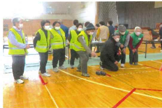
秀雄さん、がんばって!!